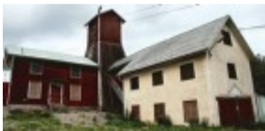
Hagelgruvan i dag.